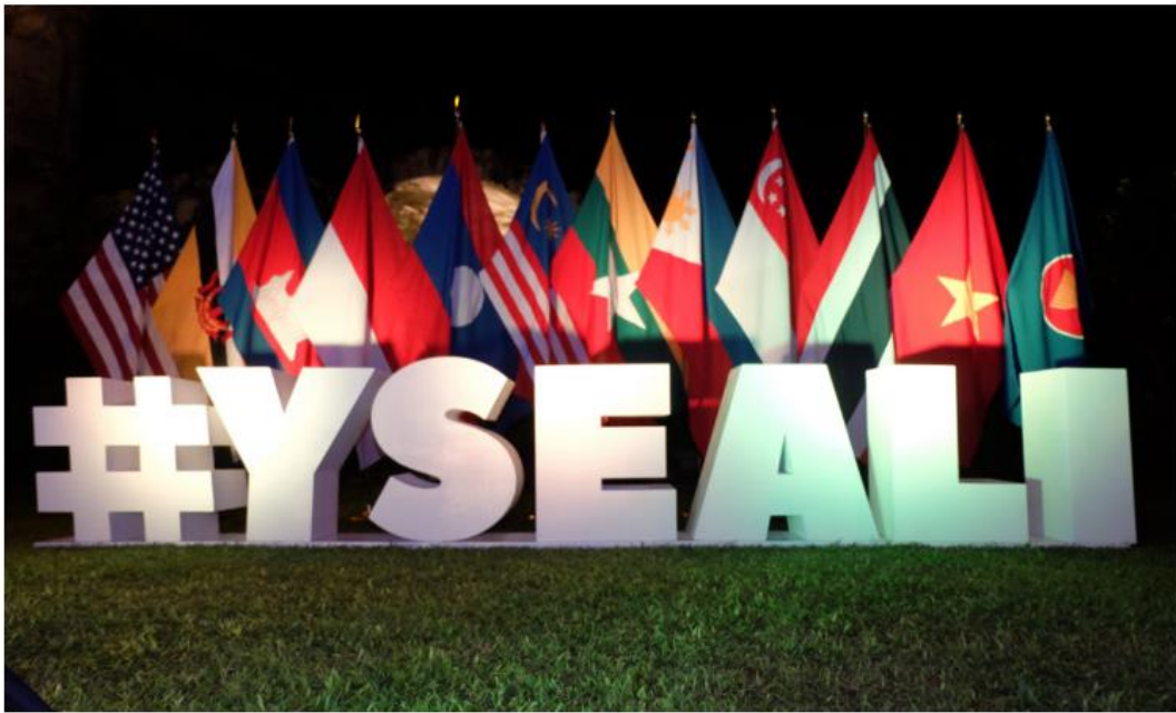
Young Southeast Asian Leaders Initiative (YSEALI)

Home | Young Southeast Asian Leaders Initiative